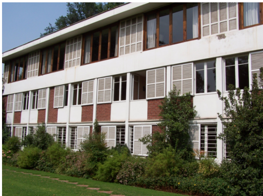
Antigua fachada de Antullanca

El 1º de junio de 2008 terminó una etapa histórica de Antullanca: era necesario hacer trabajos mayores para poder tener, en ese mismo terreno, dos casas de retiro y formación -Parque y Cedro- e instalaciones adecuadas para un centro de capacitación en hotelería y gastronomía.