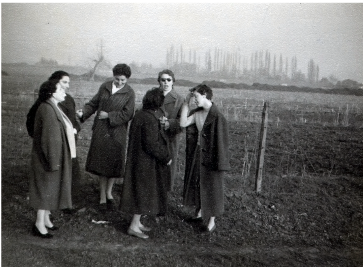
Historia de Antullanca, "Valle del sol" en mapuche.

Se trataba de un terreno en un pueblo al oriente de Santiago -Lo Barnechea- el que con el paso de los años y el crecimiento de Santiago, quedó inmerso en la ciudad.